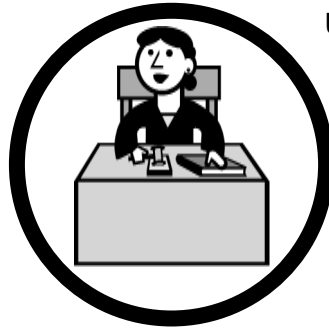
El tribunal de Tarjetas de Crédito está en sesión.

SI el demandante puede proveer documentación y alcanza su carga de prueba, quizás usted puede considerar hacer un arreglo de pagos.